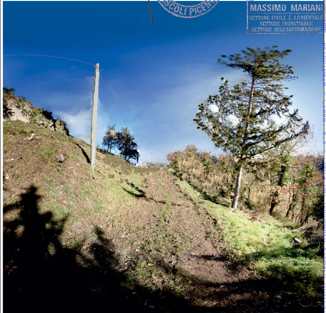
Punto di ripresa fotografico n° 1 (ante-operam)