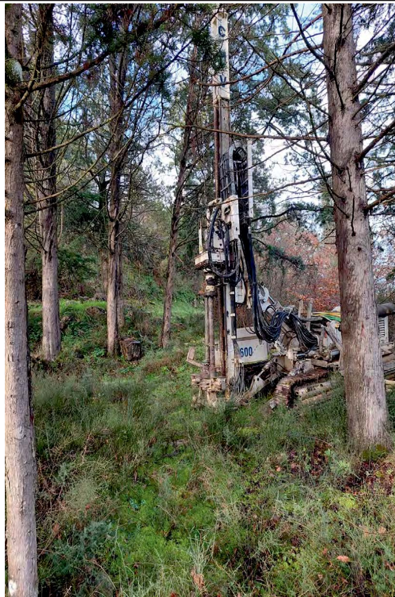
Particolari essenze arboree (Cupressus Arizona)