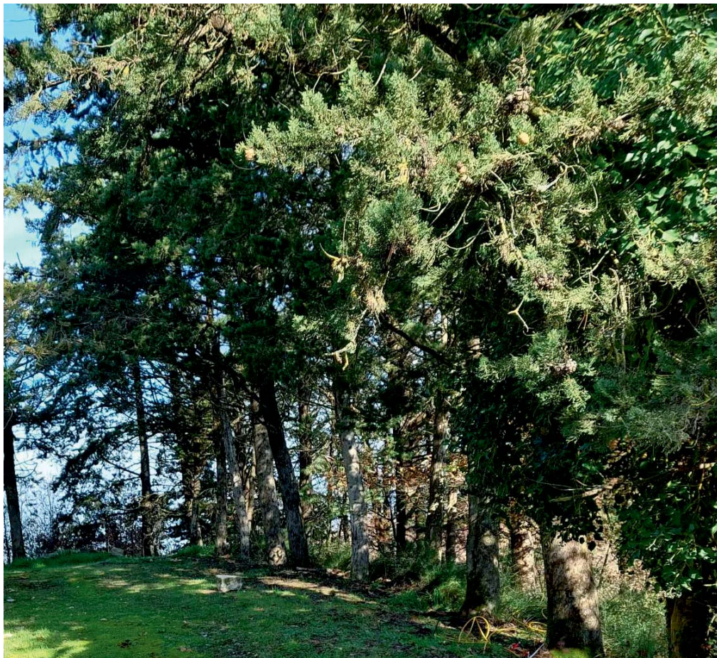
Vista essenze arboree (Cupressus Arizona)