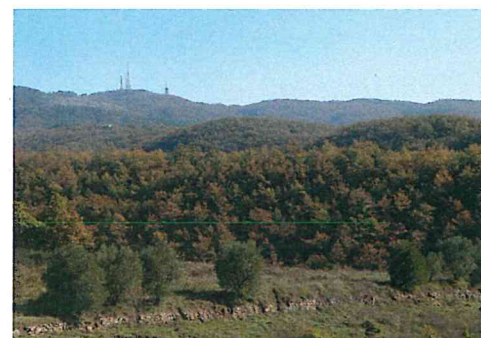
Il Comprensorio del Peglia, dopo una complessa istruttoria, è stato prescelto quale candidatura della Repubblica italiana per l'anno 2017, insieme alla Valle Camonica, a divenire Riserva mondiale della Biodiversità MAB Unesco