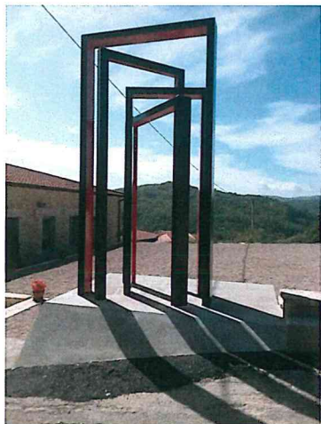
Nell'ambito del festival Architettura e Natura 2017 è stata installata a Poggio Aquilone un'opera artistica ambientale creata da Renzo Gallo.