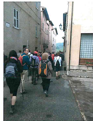
Tanti gli eventi sportivi e culturali organizzati durante l'estate in collaborazione con le associazioni, dai concerti al giro podistico dell'Umbria, dalle passeggiate escursionistiche al primo Raduno dei Vulcani in Mountain Bike.