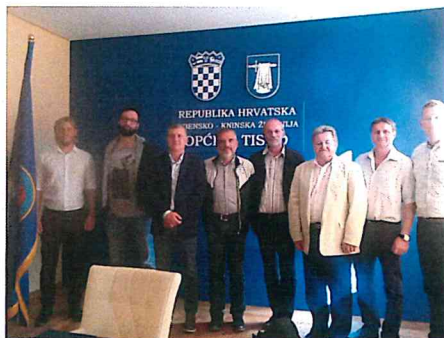
Sottoscritto il protocollo per un rapporto di amicizia e collaborazione tra il nostro comune e quello di Tisno (Croazia).