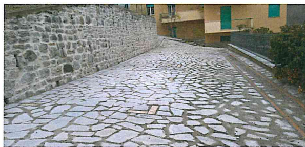
Tra i principali interventi la ripavimentazione, a San Venanzo, di alcune vie interne e della piazzetta in via della Vittoria, la riasfaltatura di parte della strada di collegamento tra Poggio Aquilone e Marsciano, la riqualificazione dell'ex scuola elementare di Ospedaletto.