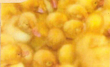
"Insieme" Eleonora Margutti – 1° classificato al concorso 2012

b) Il tema deve fare riferimento alla flora (dal filo d'erba all'albero) e alla fauna (mammiferi, rettili, uccelli, anfibi e pesci).