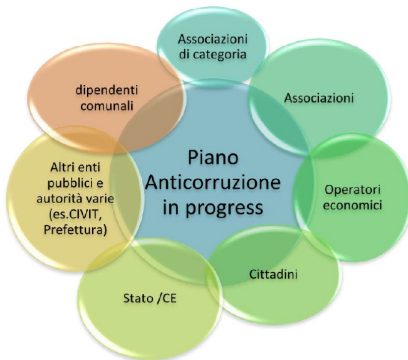
Figura 1 - Piano Anticorruzione Comunale e portatori di interessi